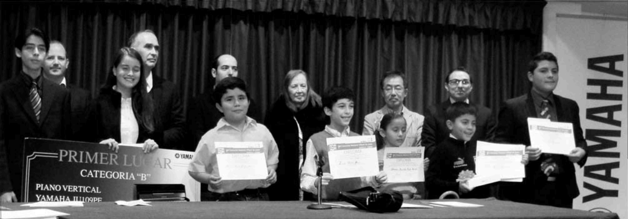
Ganadores del Concurso Nacional Infantil de Piano, con los miembros del jurado y organizadores.