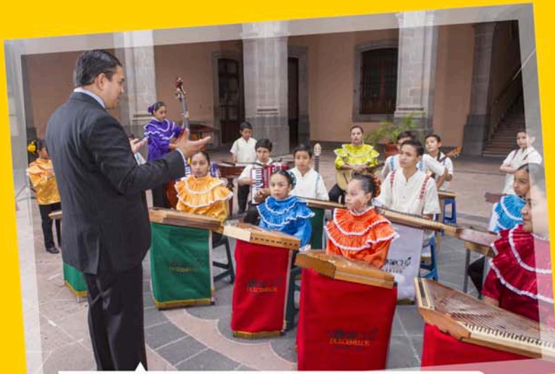
Los niños "Makochi" en sesión fotográfica, material que servirá para la portada de su nuevo disco.