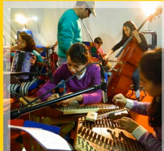
En las instalaciones de Radio UAQ fue grabado el segundo disco de la Orquesta Infantil de Salterios Makochi Dulcemelos.