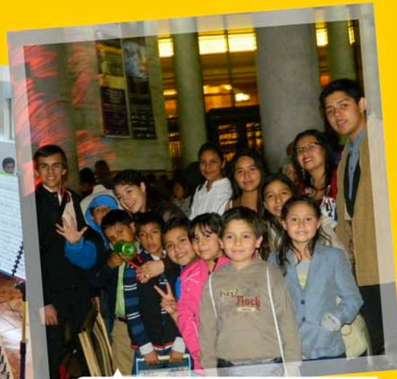
Los integrantes de la Orquesta Makochi, acompañados de sus padres y maestros, asistieron al concierto del Dueto Dulcemelos, el 9 de diciembre en la Sala Manuel M. Ponce del Palacio de Bellas Artes.