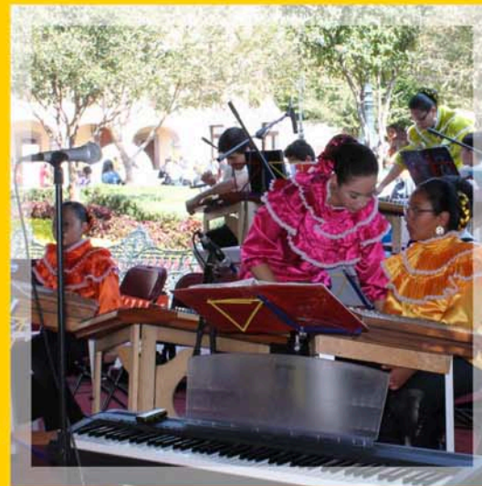
En Plaza de Armas se apreció el talento de los jóvenes salteristas, durante el concierto de la Orquesta Makochi, el pasado 26 de enero.